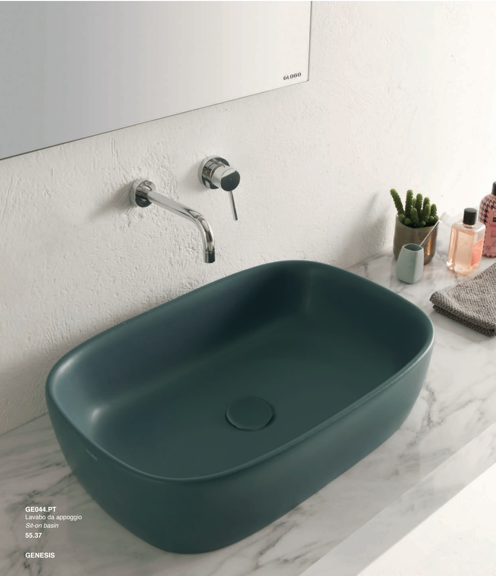
GE044.PT Lavabo da appoggio Sit-on basin 55.37