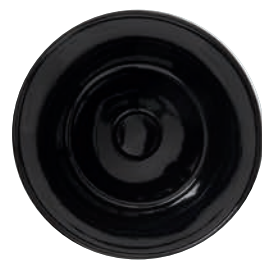
Nero lucido NE