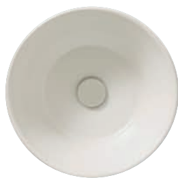
Bianco opaco BO