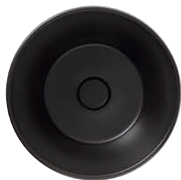
Nero opaco AR