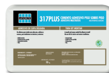
Presentación: 10 kg